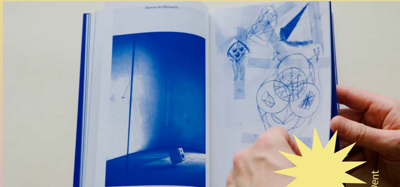
Alteritat Radical.